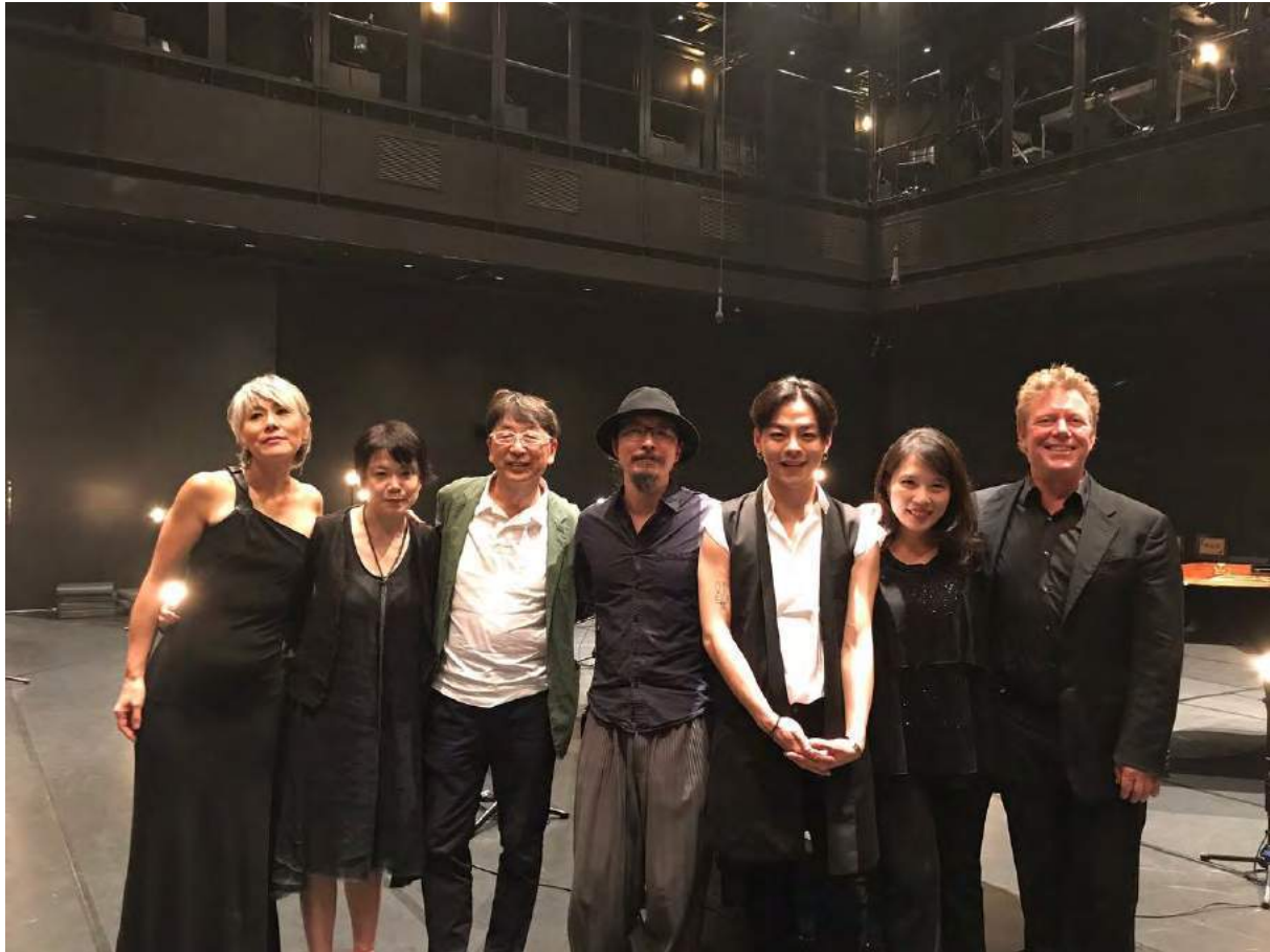
Team Multus #3 met gasten van het concert: stoffenontwerper Yoko Ando (2 e van links) en de architect van het National Taichung Theater, Toyo Ito (3 e van links)

'I would like to continue to perform Canto Ostinato, and to present it to new audiences all over the world. The work is a road map for a democratic collaboration of musicians. It is therefore a work with a political significance to the audience. I feel it is very important to perform it. For me, Canto Ostinato is just as important as any work by Bach.'