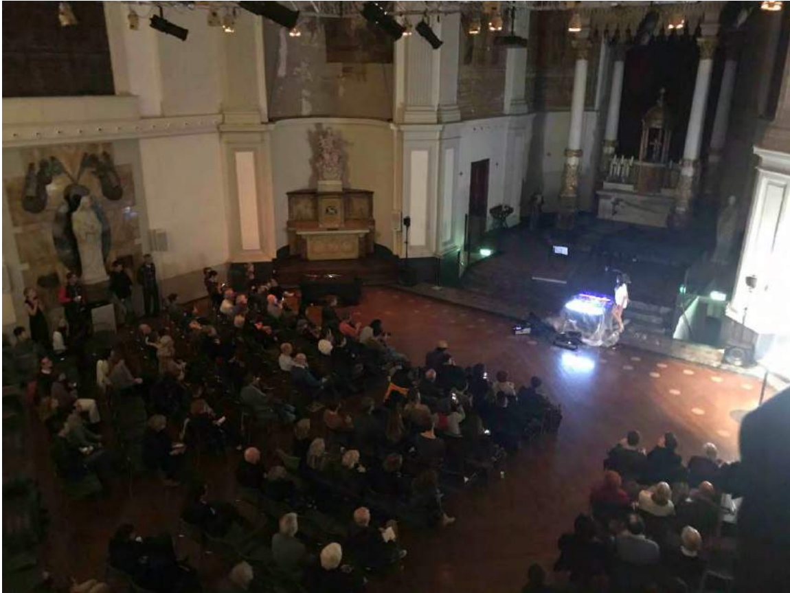
Jija Sohn tijdens haar performance in Super T-market X Japan-market